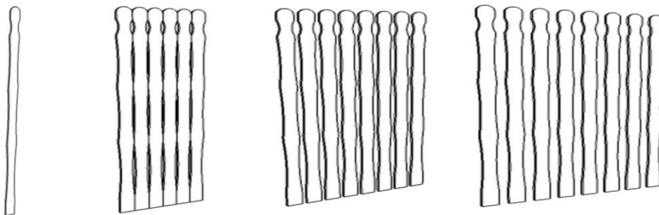
5. ábra Elemkészlet - Kerítés

A Wekerletelepen az ablakokhoz hasonlóan sarkalatos probléma a kerítések kérdése. A kerítések színbeli, anyagbeli és méretbeli kavalkádja, szintén megbontja azt az egységet, amely a telep különlegességét és egyediségét adja. Persze egységes kerítés kialakítása nem várható el minden lakótól. Az elemkészlet azonban itt is megoldást jelenthet. Különböző faragású fakerítés-lécekből minden lakó szabadon választhat és a saját igényeinek megfelelő sűrűségbe helyezheti el a léceket. Bár így mindenki maga dönt a kerítéséről, mégis egységes arculatot biztosítunk a telepnek.