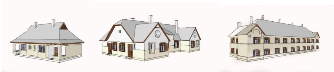
1. ábra Fleisch 1. típus

Kutatásunkat két fő részre tagoltuk. Az első rész egy felmérés volt, melyet kérdőívek segítségével végeztük. Ennek során házról házra jártunk, beszélgettünk az emberekkel, és eközben kérdőívek formájában (80 darabot töltöttünk ki) faggattuk őket itteni életükről, házuk állapotáról. Ezzel az volt a célunk, hogy megismerjük az ott élők véleményét és vágyait a saját lakásuk és a Wekerletelep jövőjével kapcsolatban. A második részben a változásokat vizsgáltuk. Azt figyeltük meg, hogy milyen átalakítások történtek a házak eredeti formájához képest. Ennek során három típusházat emeltünk ki. Fleischl Róbert 1-es típusú 2 lakásos, Árkay Aladár és Kallina Géza 3-as típusú 4 lakásos és Palóczy Antal 4-es típusú 12 lakásos házat.